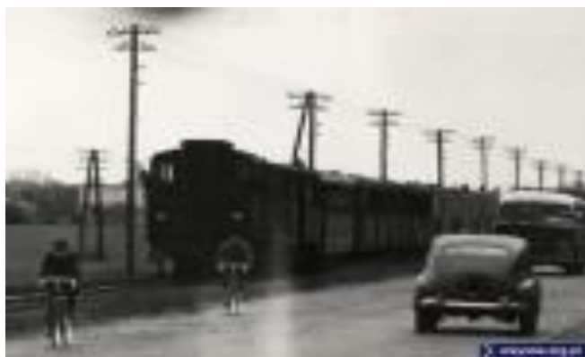
„Ciuchcia” wzdłuż Puławskiej