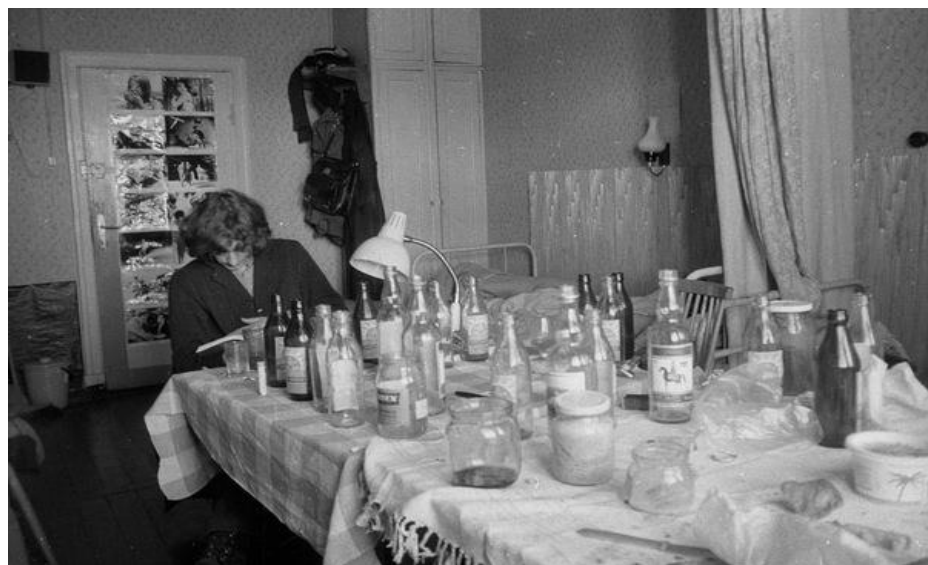
Po imprezie- trzeba się uczyć -Jelonki