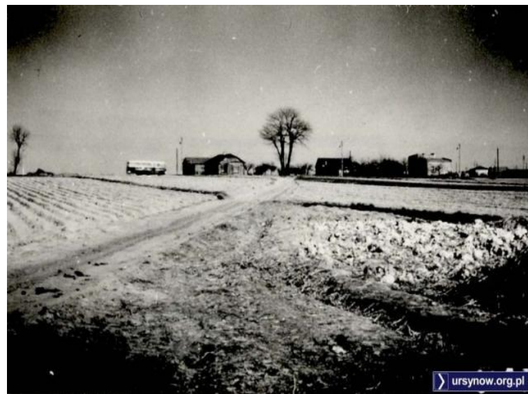
Polna droga - ul.Migdałowa. W oddali 104.