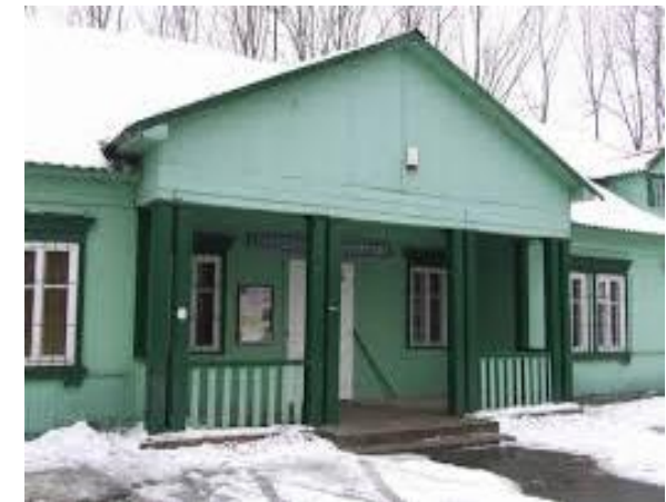
DS. męski -Jelonki