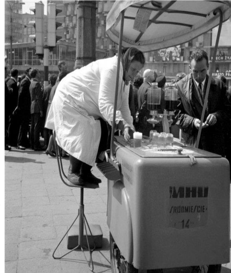
Symbol PRL - H 2 O z jednej szklanki na łańcuchu