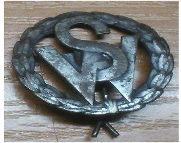
Odznaka SW na pagonach

Kto będzie się spóźniał na zajęcia, będzie miał osobisty stosunek z płk ..... A to nie jest przyjemne, wiem, bo sam miałem".