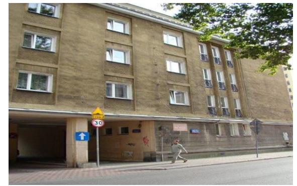
DS. żeński ul. Madalińskiego

Ja za kratą Ty za kratą mimo wszystko będę tatą (piosenka z Juwenaliów)