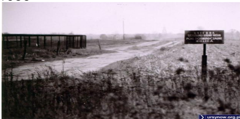
Pole Katedry Szczegółowej Uprawy Roślin Wolica