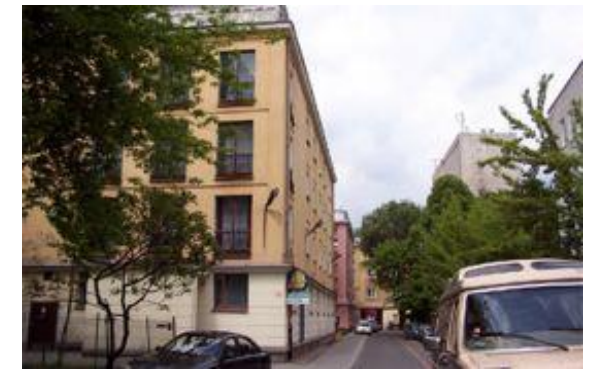
DS żeński. ul. Fałęcka