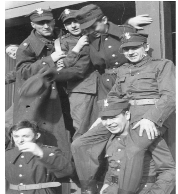
Studenci w mundurach