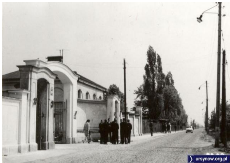
SGGW – ul. Nowoursynowska, widoczny bruk. Studenci czekają na autobus.