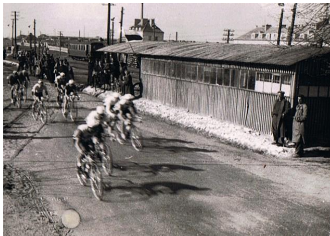
Puławska, Wyścig Pokoju 1956