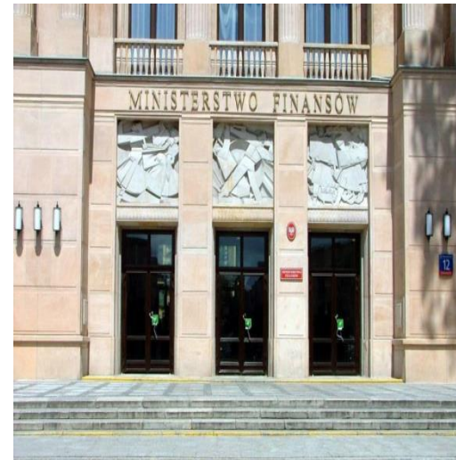
MF – dobrze płaciło za sprzątnięcie, mycie okien