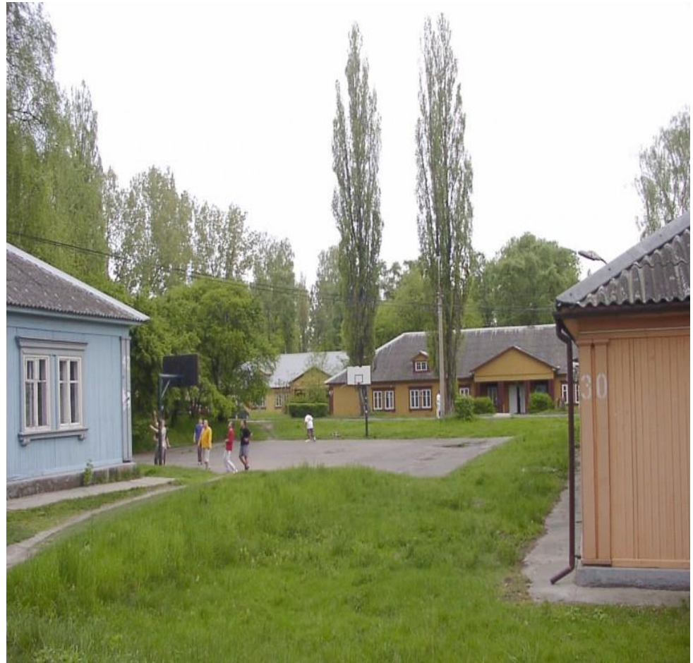
Układ przestrzenny bloków na Jelonkach