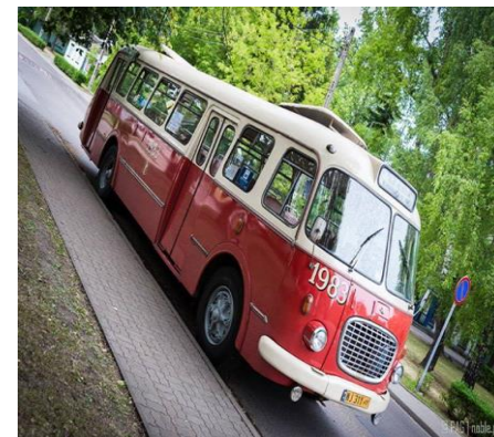
Autobusy Chausson i Jelcz